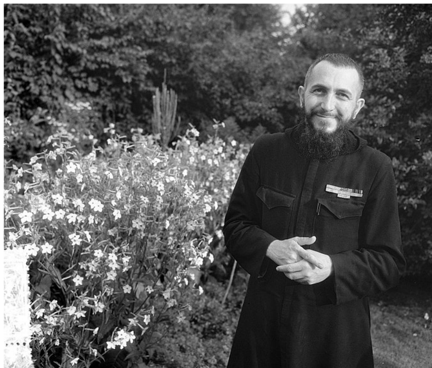
Photo : Conférence de l'Organisation de la paix de l'Union mondiale Abbé PIERRE. La reprise d'après-guerre des Pays-Bas, 1955.

Abbé PIERRE Croix de guerre 39/45. Médaillé de la Résistance. Médaillé de la Légion d'Honneur.